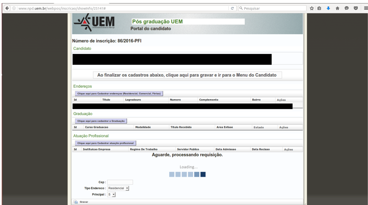
Figura 2: Figura que se refere ao erro de carregamento da cidade

A página entrará em carregamento e não encontrará a cidade selecionada.